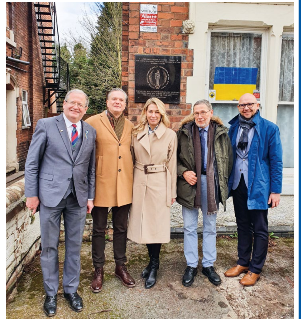
Asmeninio archybo nuotr. – Vizitas Nottinghamame