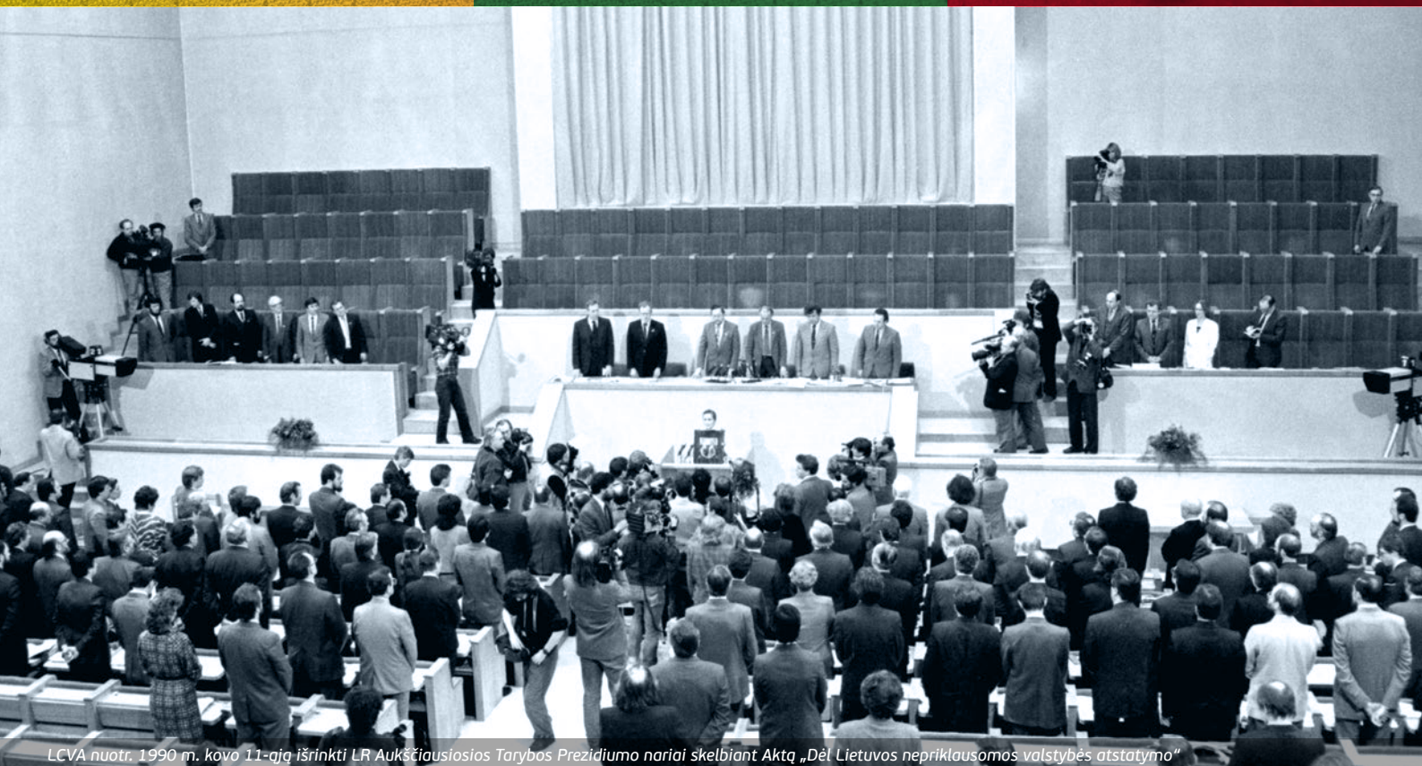
1990 m. kovo 11-ąją išrinkti LR Aukščiausiosios Tarybos Prezidiumo nariai skelbiant Aktą „Dėl Lietuvos nepriklausomos valstybės atstatymo“